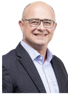
Hug René SP 981 Stimmen (bisher)